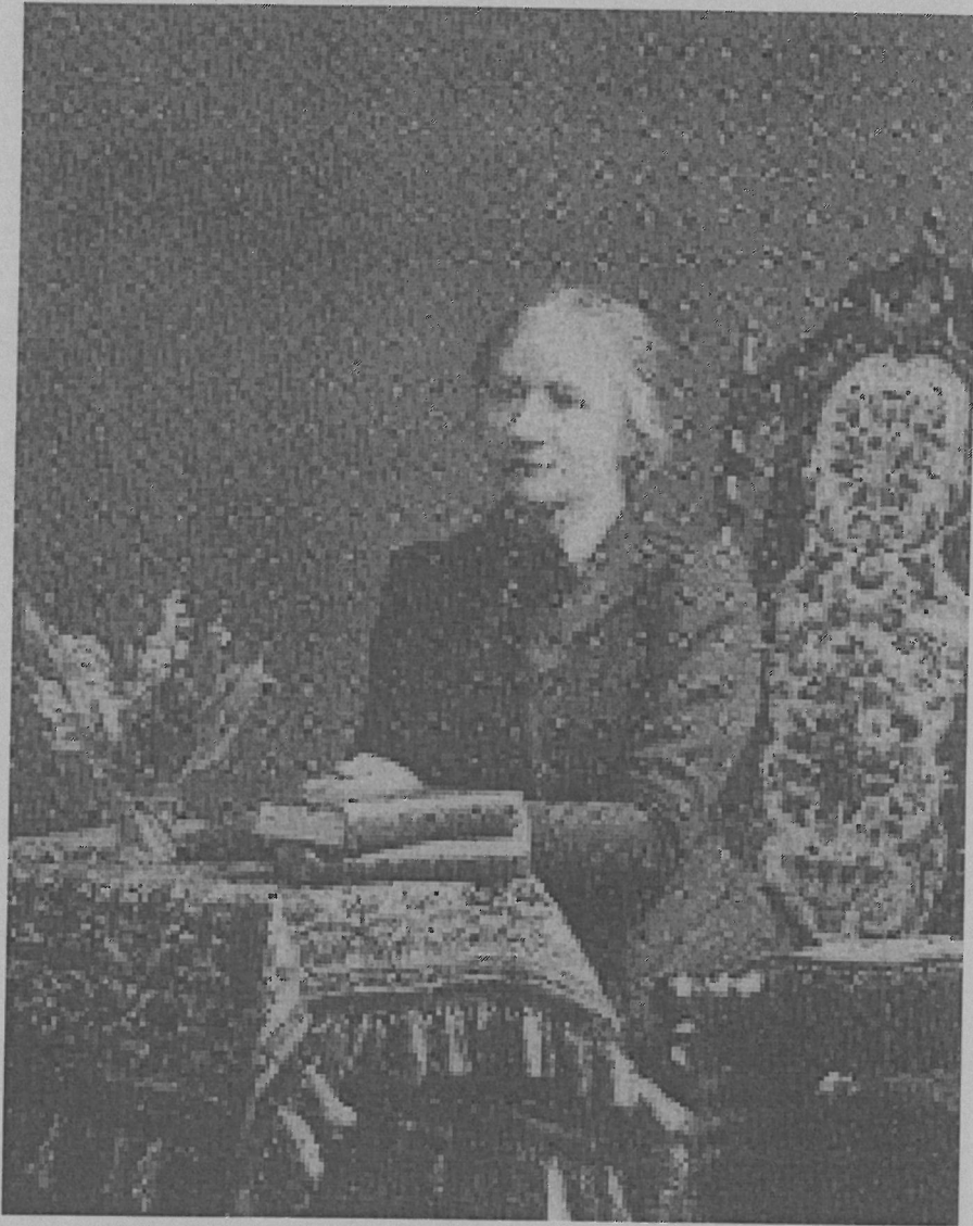
Ellen Key som föreläserska vid Arbetareinstitutet