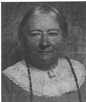
Ellen Key (1849-1926)