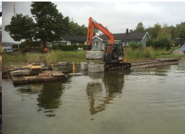
Sjöledning från Äppeludden till Gertrudsvik

100 fritidshus får i och med detta en mer långsiktig VA-lösning och utsläpp av övergödande till känsliga vikar minskas.