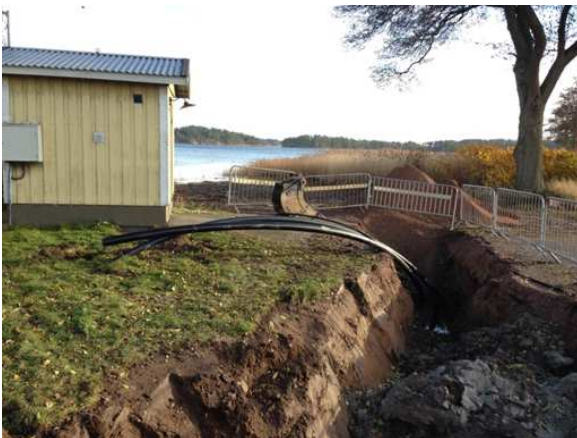
Sjöledning från Tättö till Loftahammar

Äppeludden på Norrlandet och Tättö fritidsområde utanför Loftahammar har båda nyligen färdigställt sjöledningar till allmänt vatten och avlopp.