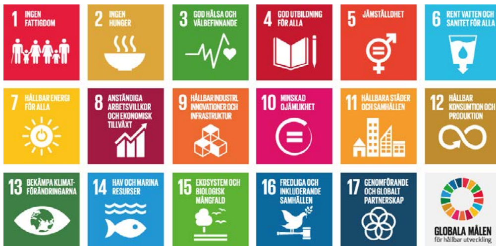
Figur. 2. Globala hållbarhetsmål ( www.globalamalen.se )

förväntningar på att bidra till hållbar utveckling återspeglas i EU:s politik. Ett exempel handlar om att man inom EU valt att arbeta med cirkulär ekonomi 14 , se faktaruta 1 (sid. 12).