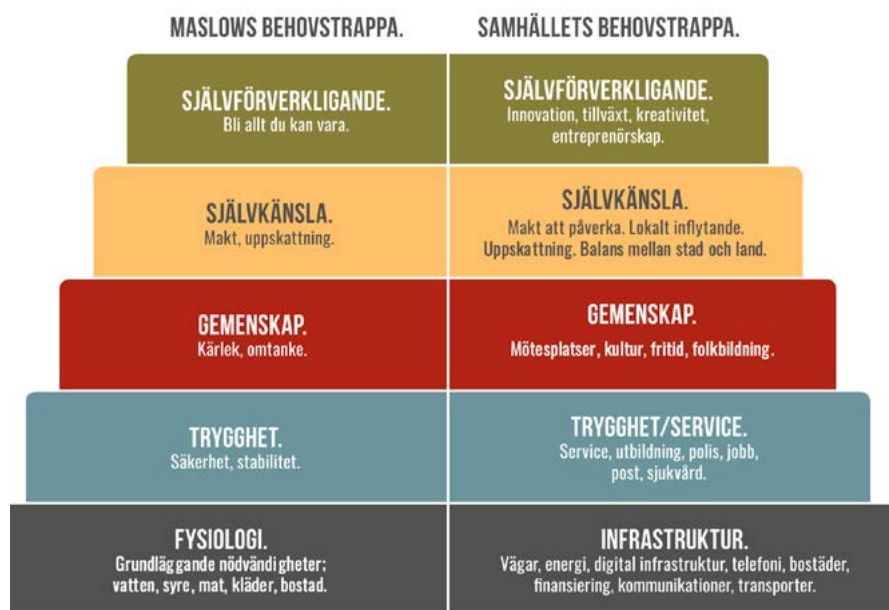
Figur. 3. Samhällets behovstrappa

ska kunna fördelas annorlunda och förutsättningarna bli mer jämlika 74 . Att initiativ och innovationer i någon högre grad ska vara avhängt enskilda eldsjälar är inte rimligt. Landsbygdskommuner och organisationer som verkar på landsbygden behöver alltså skapa förutsättningar för ett långsiktigt lokalt engagemang för ekologisk- och social hållbarhet. Det här bör ske på olika nivåer. Hela Sverige 75 har tagit fram en modell för vad samhället behöver för att leva, se figur 3, inspirerad av Maslows behovstrappa 76 . Den här modellen kan tjäna som utgångspunkt för hur organisationer och kommuner kan skapa förutsättningar för ekologisk- och social hållbarhet på landsbygden.