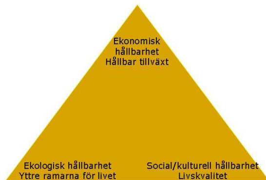
Figur 1. Hållbarhetens tre dimensioner

Den ekologiska dimensionen ger de yttre ramarna för biologiskt liv. Vi är alla beroende av naturen och dess kretslopp för att vi ska kunna överleva. Om ekosystemens funktioner utarmas och kollapsar kommer hälsa, välbefinnande och ekonomisk utveckling inte kunna upprätthållas. Den ekologiska dimensionen sätter gränser för vad naturen tål. De 16 av riksdagen beslutade miljö kvalitetsmålen beskriver tillståndet i miljön för ett samhälle som från ekologisk synpunkt kan bedömas ha en hållbar utveckling. Målen skall uppnås till 2020 och är vägledande för tolkningen av miljöbalken.