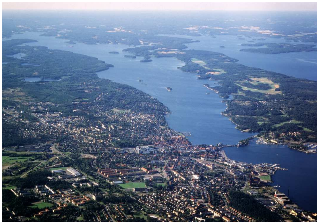
Gamlebyviken i Västerviks kommun

För att belysa läget i Västerviks kommun och hur bristerna ytterligare skall åtgärdas pågår arbete med att ta fram en VA-plan som ett tematiskt tillägg till Översiktsplanen. Krav ställs på ökade insatser för vattenvårdsåtgärder inte bara inom fysisk planering. Pågående projekt i kommunen för att minska övergödningen berör även lantbruket och båtturen.