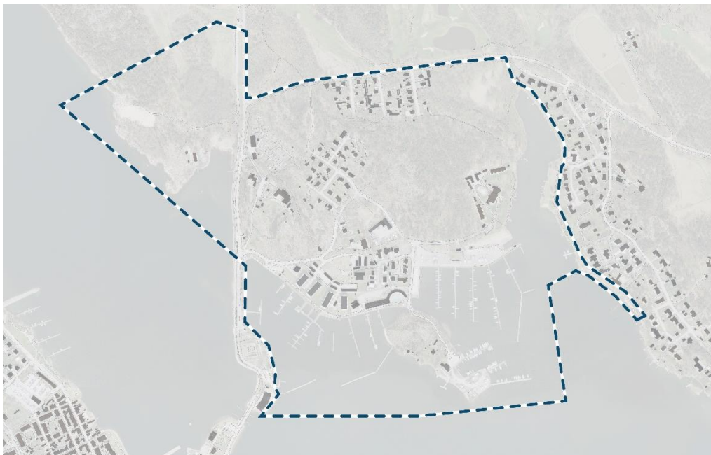
Figur 1. Karta över södra Norrlandet med planområdet markerat med blåstreckad linje.

Planprogrammet är förenligt med intentionerna i översiktsplanen. Planprogrammets genomförande förutsätter att strandskyddet upphävs inom delar av planområdet.