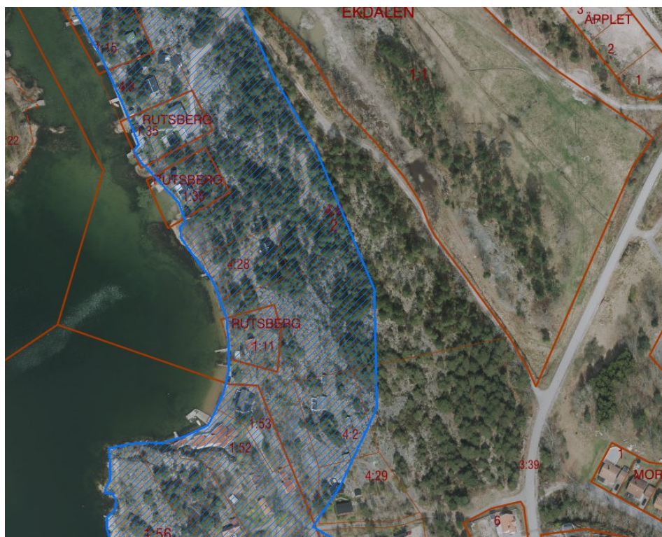
Utbredning av strandskydd, 100 m inom området.

Inventeringen konstaterar att området används av de boende som närreklamationsområde samt att relativt omfattande hänsyn måste tas för att bland annat säkerställa att den rödlistade arten apollofjäril (NT) fortsatt kan finnas inom området.