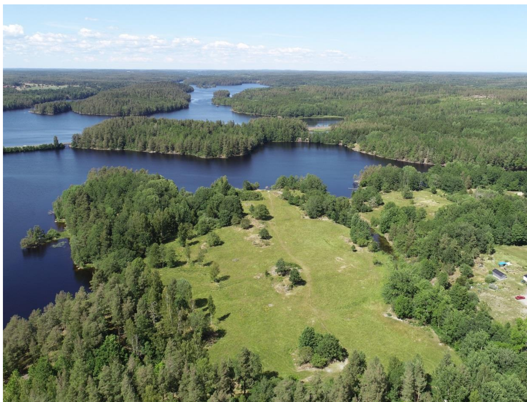
Vy över föreslaget planområde.