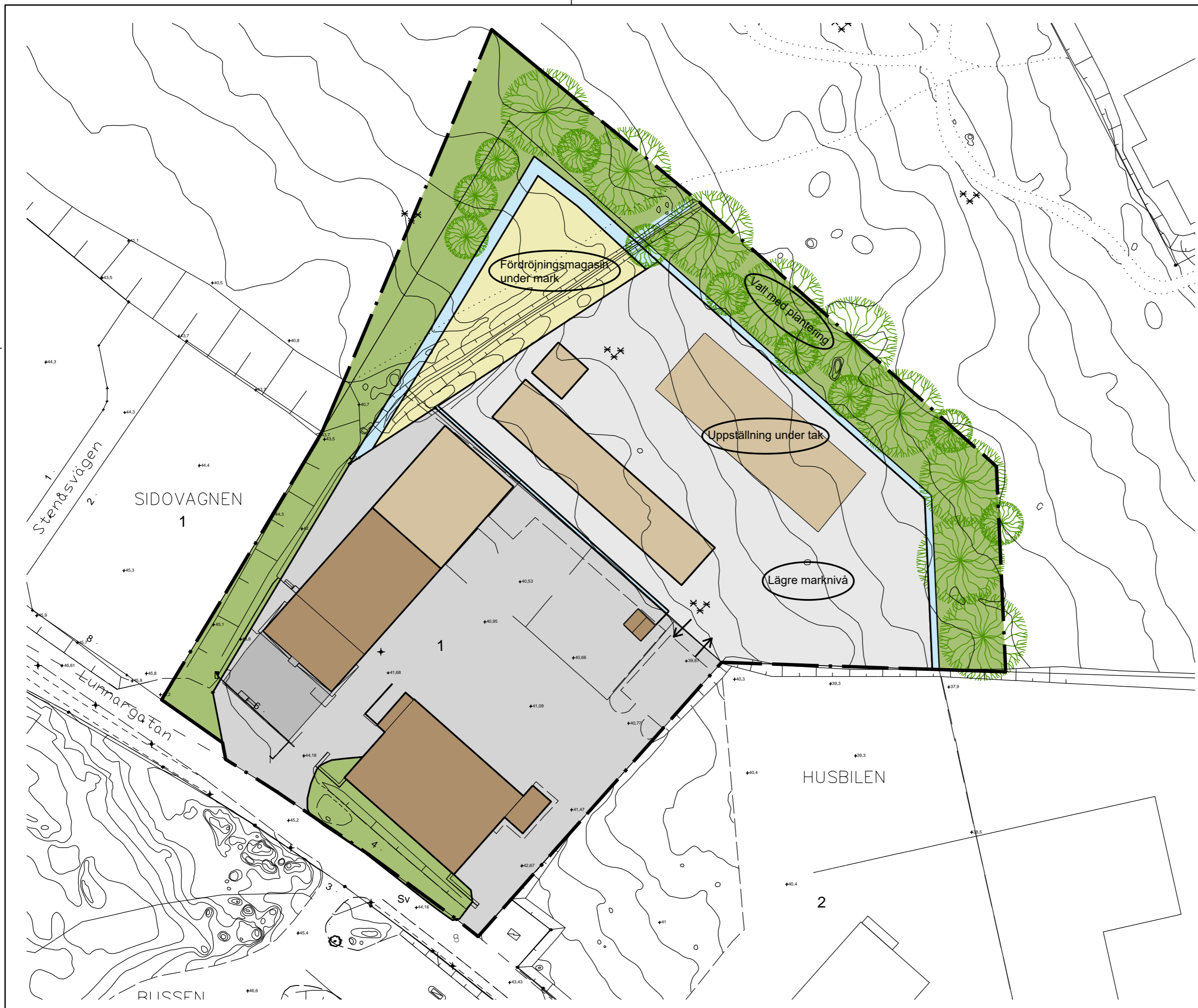
ILLUSTRATION 1:1000 (A2)