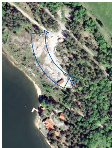
Ortofoto över planområdet, den blå linjen visar plangränsen.

Ändringen av detaljplanen medför ingen förändring av nuvarande förhållanden.