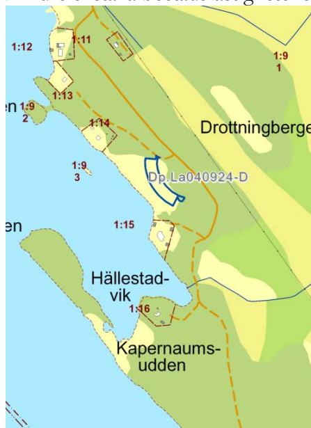
Karta över detaljplanens läge tillsammans med omkringliggande bebyggelse.

Den fastighet som planen berör ligger i Lofta, strax norr om Västerviks tätort. Området ligger utmed kusten och omgärdas av mindre enstaka bostadsfastigheter spridda längs med strandlinjen.