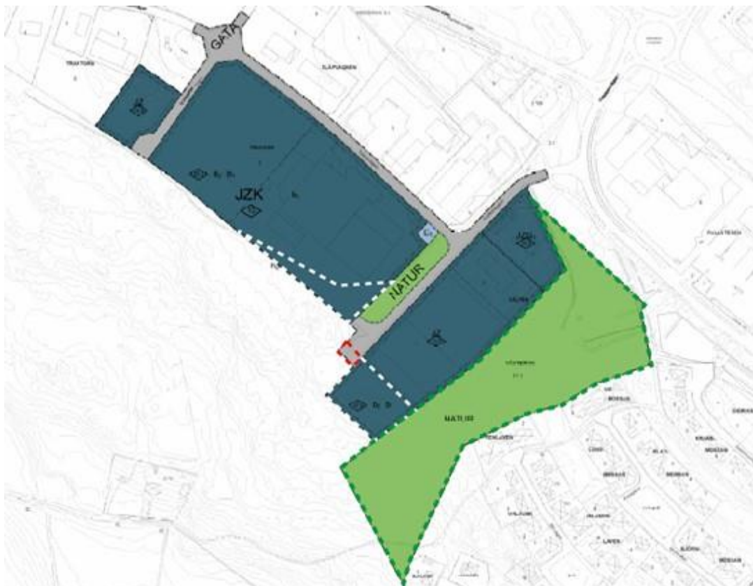
FIGUR 2: Areal över olika markanvändningar. Inom vit streckad linje tillskapas ny kvartersmark för verksamhetsändamål.

relativt små tomter kan skapas med möjlighet att erhålla större tomter om befintliga fastigheter styckas av.