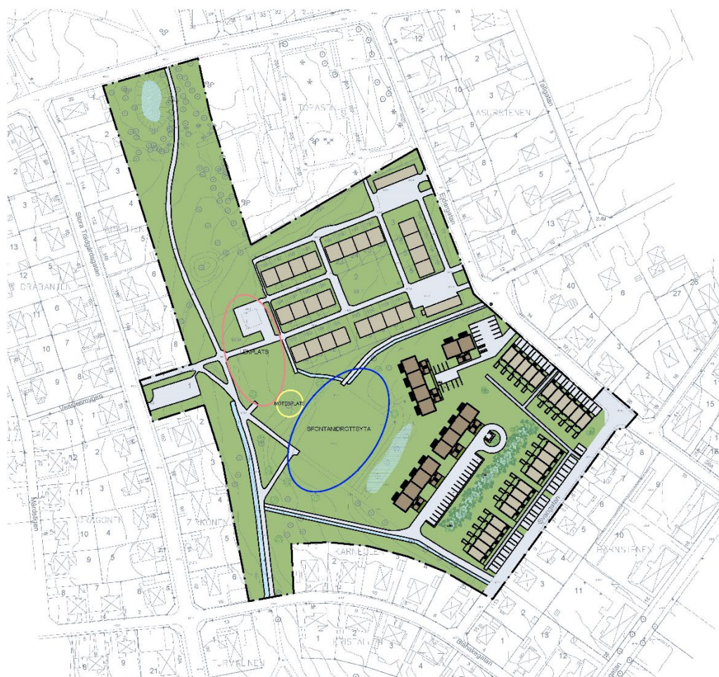
Situationsplan och illustration från FB - Bostad

Exploatören önskar utforma ett bostadsområde bestående av tvåvåningsradhus eller tvåvånings flerbostadshus. Byggnationen kommer vara i trä som avser både stomme och fasad. Inkoppling till kommunal Va-nätet. Parkering inom kvartersmark.