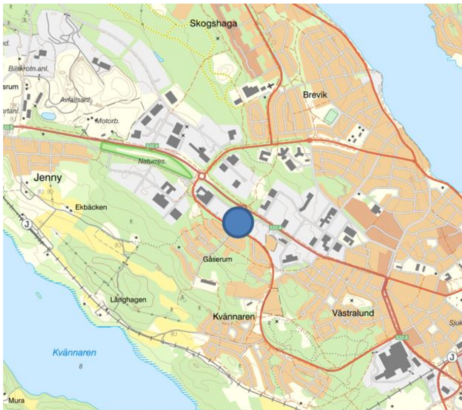
Planområdets läge i Västervik.

Idag är det en korsning med genomfart som är skyltad från infarten till Västervik för trafik till Gränsö, Lucerna hamn, Västerviks resort, Horn m.fl. Trafiken har ökat de senaste åren och med stadens utbyggnad kan det förväntas att en ökning kommer ske över tid. Samtidigt är Vattentornsvägen en viktig länk till bostäder i Didrikslund och Ljungsbergaskolan och behovet av säkra gång- och cykelpassager ökar.