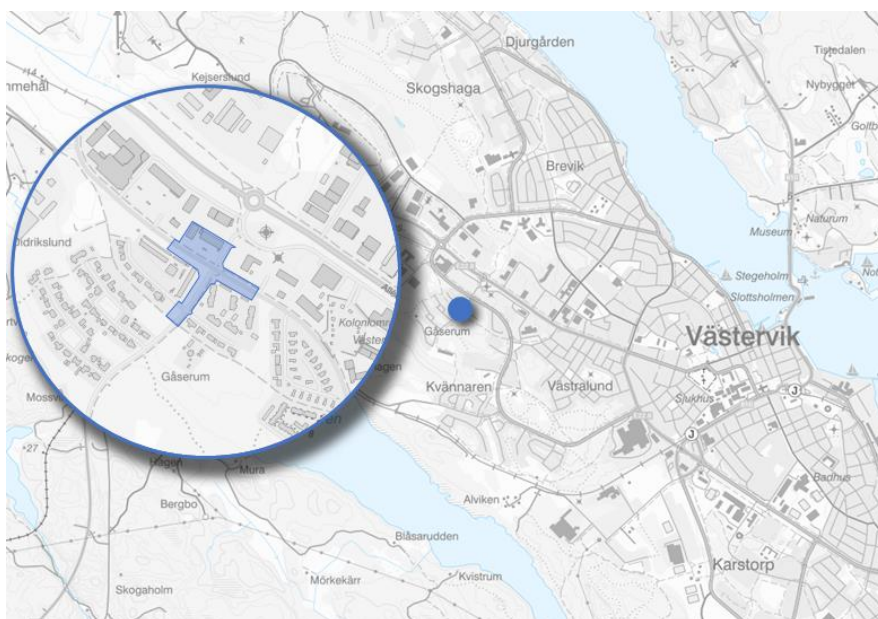
Figur 1. Planområde i Didrikslund.

Syftet med planen är att möjliggöra för en cirkulationsplats i korsningen Folkparksvägen och Vattentornsvägen. Planen syftar även till att utveckla cykelvägnätet och säkrare gångpassager. Befintliga verksamhets- och handelstomter ges ny användningsbeteckning med syfte att anpassa bestämmelsen till rådande rekommendationer från Boverket.