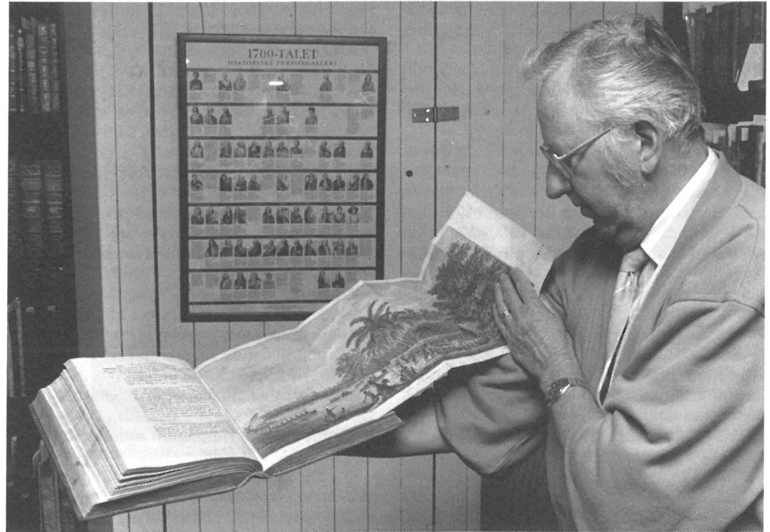
James Cooks reseskildring. (Originalutgåva med kopparstick.)