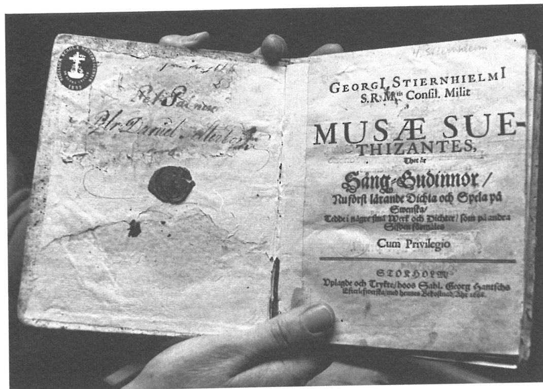
Georg Stiernhielms "Sånggudinnor" från 1668. Boken har ägts av skalden Per Daniel Amadeus Atterbom, som skrivit sitt namn på pärmens insida.

smidde en (åtminstone för Västervik) utmärkt plan, som sedan både stiftet och Västerviksskolan ställde sig bakom. Hör här! Linköpings Stiftsbibliotek ägde genom donationer en mängd dubbletter också av många sällsynta utgåvor. En formell anhållan från skolans styrelse till Stiftet om att överta dubbletterna fick, då frågan var väl förberedd, ett positivt svar. 363 värdefulla böcker bytte ägare och Västerviksskolan fick därtill löfte om att också i framtiden stå först i kön för att förvärva sådant som Linköpingsbiblioteket hade dubbelt upp av.