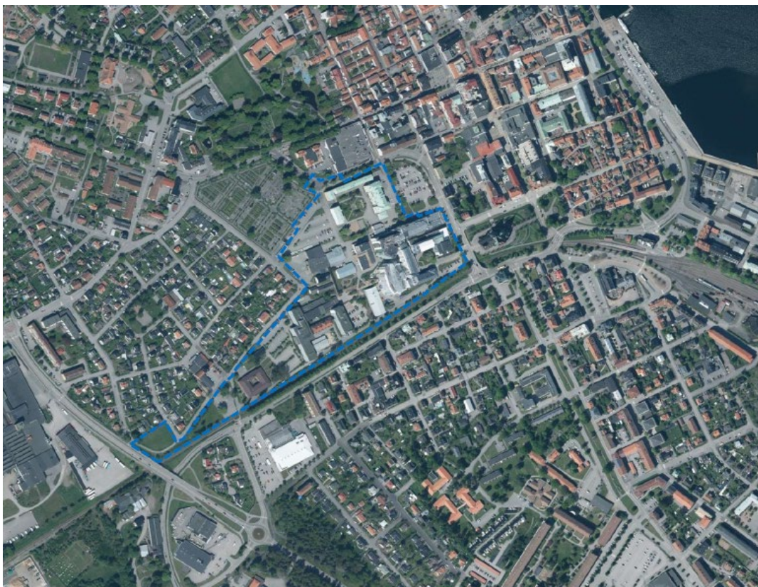
Figur 1: Blå streckad linje är planområdesgräns.

Det övergripande målet med gestaltningen för Västerviks sjukhus ska vara att åstadkomma en ordnad variation där varje byggnad har sin egen karaktär men som också bidrar till och håller samman sjukhusområdet och staden som en gestaltningsmässig helhet.