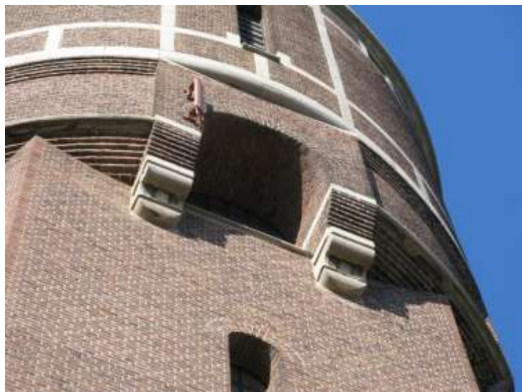
Detalj från övergången till tornets övre del.