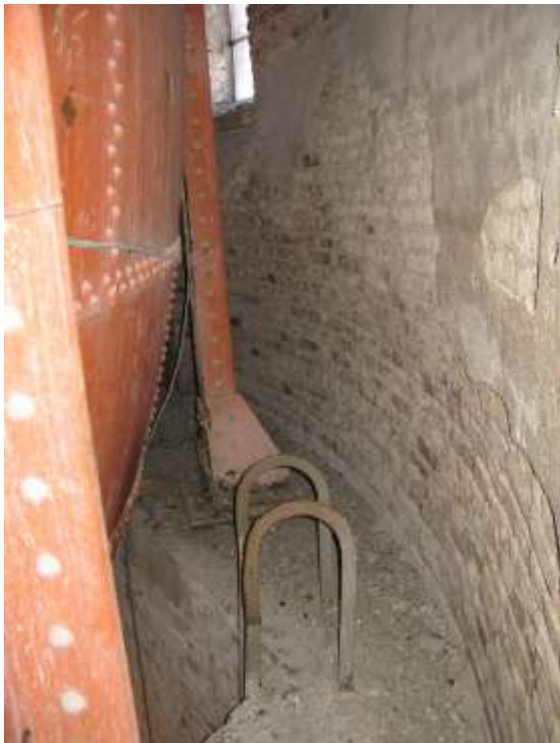
Uppe på avsatsen.