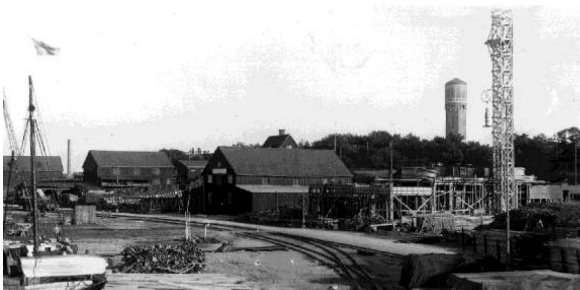
Bild från hamnen som visar vattentornets ursprungliga takform. Fotografi från 1920–30-talet.