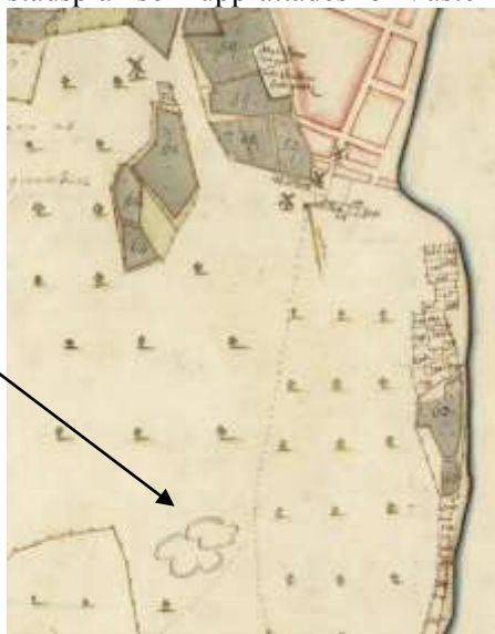
Avmätningsskarta från 1707. Pilen visar platsen där vattentornet står idag.

1678 års rutnätsplan och avgränsning av staden kom att gälla i 200 år. När staden växte under industrialismens inverkan krävdes vid slutet av 1800-talet en utökad stadsplan. År 1879 gjordes en första utvidgning i samband med att järnvägen anlades. Kring sekelskiftet 1900 tog utvecklingen ny fart och en ny stadsplan med omfattande förstadsområden antogs år 1927. Detta blev den sista heltäckande stadsplan som upprättades för Västervik.