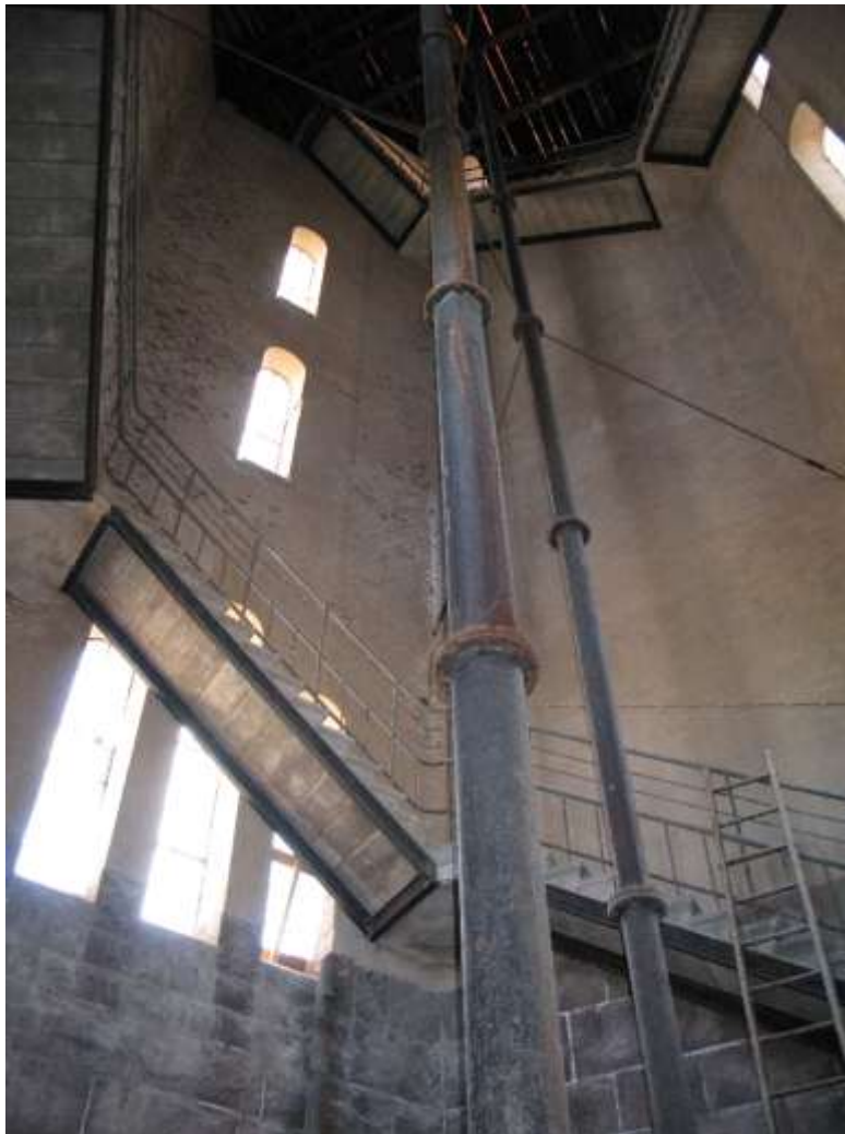
Tornets inre med vattenledningar och trappa.

Vattentornets funktion har helt fått styra utformningen av interiören. I bottenvåningen finns ett fyrkantigt schakt där vattenledningarna gick in och ut ur tornet på frostfritt djup. Schaktet omgärdas av ett järnstaket med tidstypisk utformning. På denna våning står idag en liten byggnad som rymmer apparatur till de tekniska installationer som är monterade på tornets tak. Vattenrören går rakt genom tornet från schaktet och upp till cisternen högst upp i tornets överbyggnad. En fribärande trappa av betong och järn löper utmed ytterväggarna genom hela tornets nedre del upp till överbyggnaden. Detta enorma öppna rum har i sockelvåningen väggar av granitkvadrar. Ovanför denna är murverket putsat. På de väggar som varit mest utsatt för regn och vind från havet är putsen starkt vittrad, och saltutfällningar förekommer i stor omfattning.