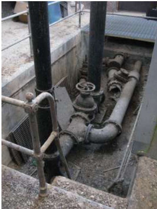
Rörgrav för anslutande vattenledningar.

Tornets överbyggnad har ett bjälklag av kraftiga fyrkantiga bjälkar av trä och av järnbalkar täckta av kraftiga ospåntade bräder som utgör cisternrummets golv. Själva cisternen är av nitad, mönjestämplat plåt. Via väggfasta stegar av järn går det att ta sig upp mellan cisternen och yttermuren och vidare upp till taket. Dessa utrymmen har inte besiktigats i samband med denna undersökning.