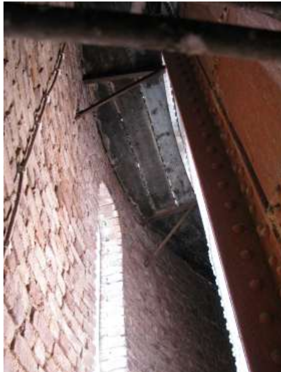
Vy från avsatsen upp mot träbrygga med järnkonsol.