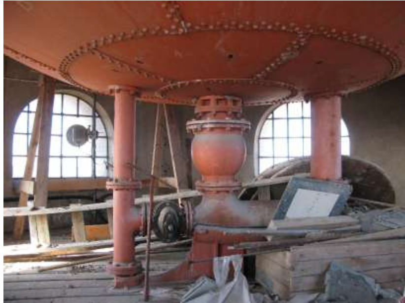
Det jättelika cisternen upptar nästan hela övre delen av tornet.

Tornets överbyggnad har ett bjälklag av kraftiga fyrkantiga bjälkar av trä och av järnbalkar täckta av kraftiga ospåntade bräder som utgör cisternrummets golv. Själva cisternen är av nitad, mönjestämplat plåt. Via väggfasta stegar av järn går det att ta sig upp mellan cisternen och yttermuren och vidare upp till taket. Dessa utrymmen har inte besiktigats i samband med denna undersökning.