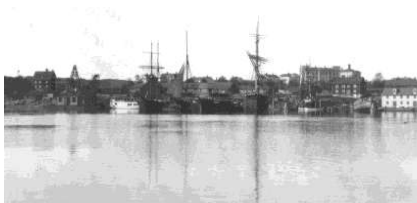
Vy från vattnet visar stadens siluett innan vattentornet byggdes. Både järnvägsstationen och fängelset har byggts, och anas till vänster i bilden.

De förändringar som skett sedan dess har varit mindre genomgripande. Enstaka nya byggnader har tillkommit och gamla har rivits. Vid Norra Bangatan uppfördes under 1950-talet en långa med trevåningshus som andas folkhemssverige och bra bostadsstandard.