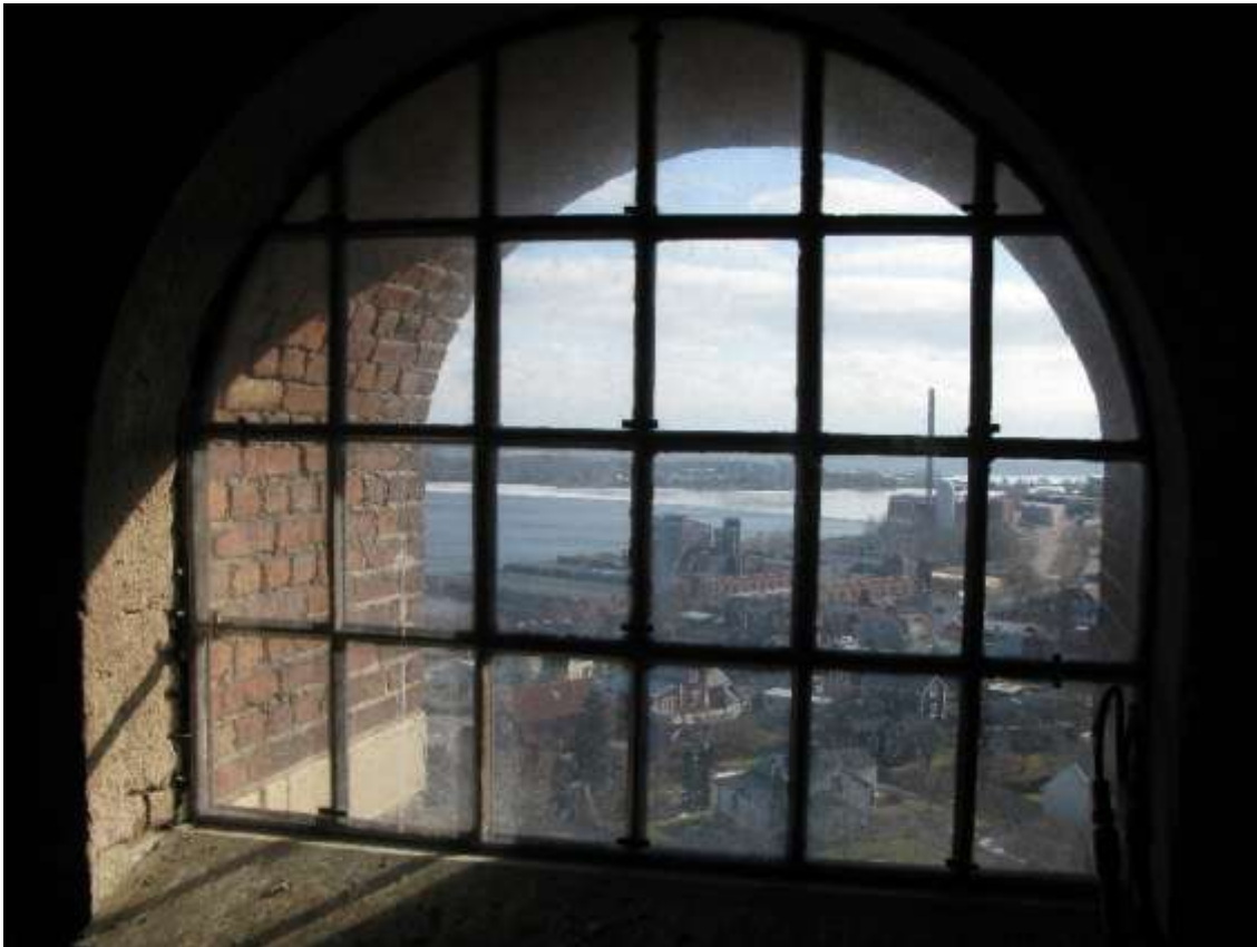
Samtliga fönster har kvar ursprungliga järnbågar.