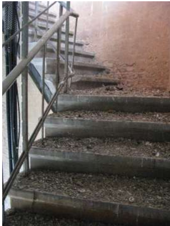
Trappan med nerfallen puts...och fågelskit.