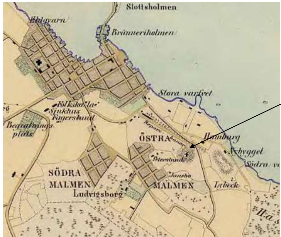
Karta från 1858 som visar att malmarna redan var bebyggda. På berget där vattentornet står är en kvarnsymbol utritad.