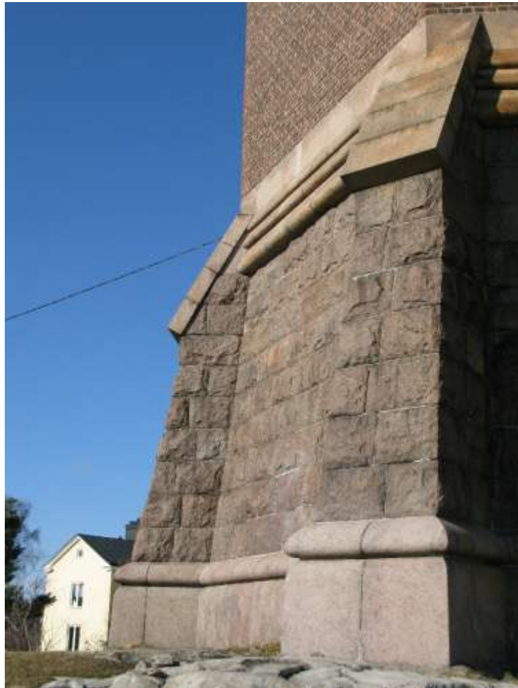
Sockelvåningen med prov på välgjort stenarbete.