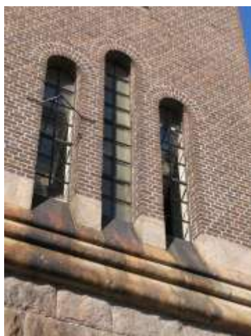
Fönster ovanför sockelvåningen.

Det 42 meter höga tornet är uppfört i en kärv nationalromantisk stil. Byggnaden är grundlagd direkt på bergets högsta punkt. Tornets nedre del har strävpelare och fasad av kvaderhuggen granit. Över denna sockelvåning reser det sexkantiga tornet med bärande väggar murade med mörkt fulltegel fogat med kalkcementbruk. Tornets runda överbyggnad som rymmer själva cisternen är bredare än undre delen av tornet och bärs upp av konsoler. Överbyggnadens fasad har en dekorativ indelning av huggen granit som kontrasterar mot det mörka teglet. Tornet har höga smala fönsteröppningar i fyra nivåer på tre av sidorna. I de ursprungliga spröjsade gjutjärnsbågarna har glaset ersatts av plastskivor. Dörren till tornet har markerad omfattning av huggen granit som kröns av Västerviks stadsvapen och året 1905. Den ursprungliga dörren har bytts ut i sen tid mot en metalledör av modernt standardutförande. Överbyggnaden kröns idag av ett järnstaket. På äldre fotografier syns att tornet från början haft ett lågt tak, som en tillplattad kupol.