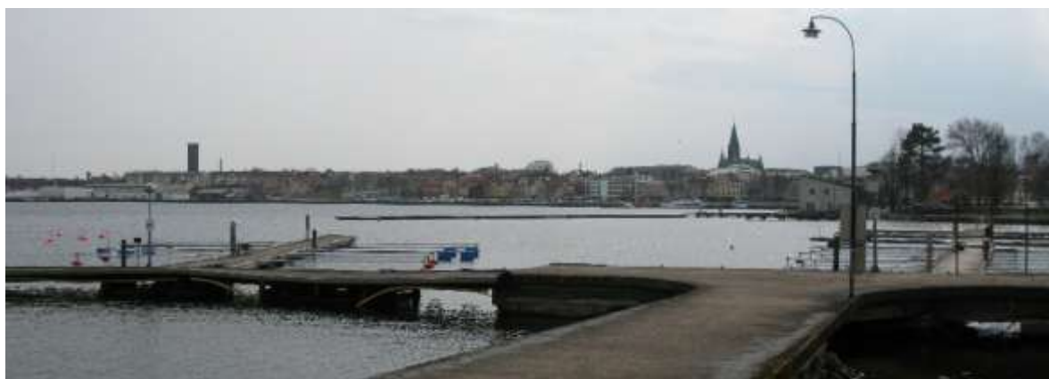
Nytagen bild med vy från Norrlandet som visar vilket markant inslag vattentornet är i Västerviks stadssiluett.