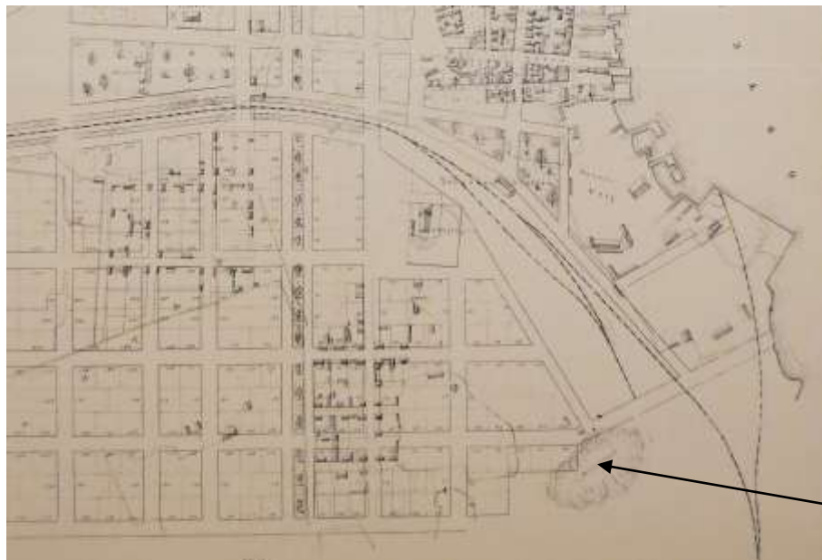
Utsnitt av karta som visar 1879 års stadsplan. Stadsbebyggelsen når ända fram till berget, som på kartan benämns "Qvarnberget".