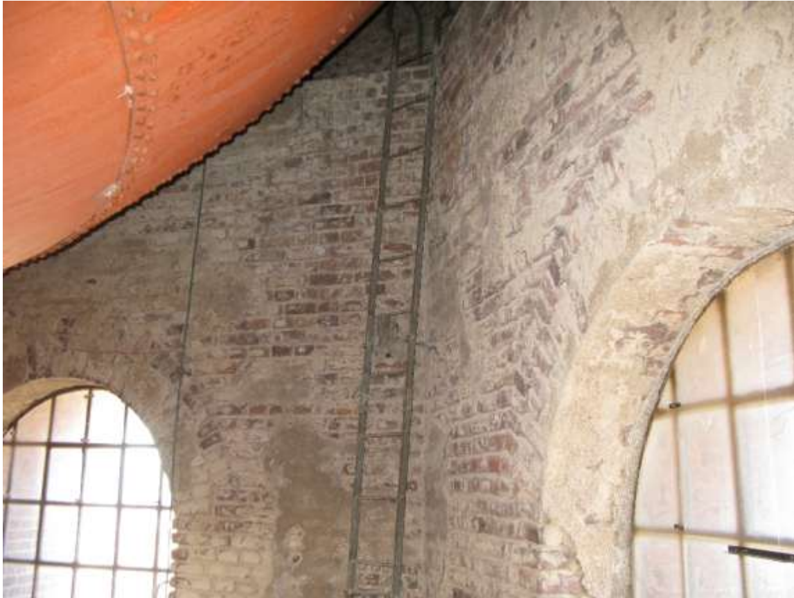
Stegen leder upp till avsatsen där cisternens bärande fundament är fästa.