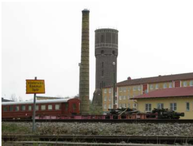
Vattentornet från norr med spårområdet i förgrunden.